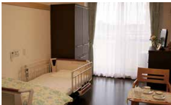
住居 ※実際の居室に家具を入れたイメージです 18.0~19.8㎡ 大きな窓で明るく、家具を入れても圧迫感のない広さのお部屋です。

“健やかにいきいきと暮らせるまちづくり”に貢献したい—。 私たちは医療と介護の視点から未来を見据えた活動を始めます。 高齢者の方が、活力を持って安心して暮らせるように。 健康に心配があれば、誰もが医療を受けられるように。