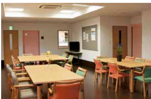
食堂・談話室 73.66㎡ 毎日のお食事や、入居者さま同士の交流の場としてご利用ください。