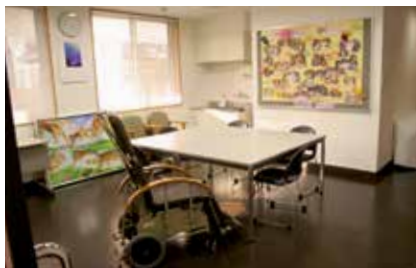
地域交流室兼機能訓練室 30.5㎡ 機能訓練室を地域交流室として開放しています。 地域の皆様の交流の場としてご利用いただけます。