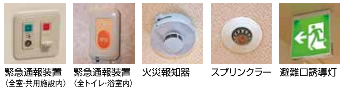
緊急通報装置 (全室・共用施設内) 緊急通報装置 (全トイレ・浴室内) 火災報知器 スプリンクラー 避難口誘導灯