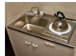
ミニキッチン 安全性により配慮し、IH一口コンロを設置しました。