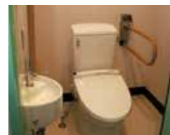
トイレ(住居用) 引き戸や手すりを付けたバリアフリーで、車いすでもご利用できます。