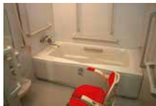
浴室(ユニットバス) 1階/3.82㎡ 2階/6.0㎡