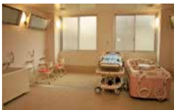
浴室(特殊浴) 32.6㎡ 介護用浴槽を設置し、障がいのある方でも安心して入浴していただけます。