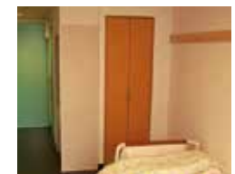
収納 備えつけの収納スペースを確保。大きな荷物もスッキリ片付きます。